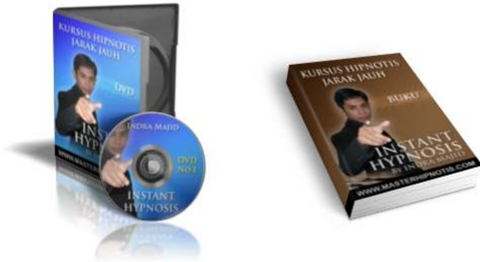
Ilustrasi Buku & DVD Instant Hypnosis untuk Kursus Hipnotis Jarak Jauh