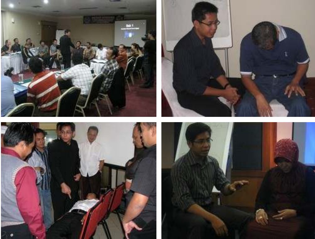
Suasana Pelatihan Instant Hypnosis