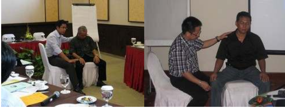
Suasana Pelatihan Advanced Hypnotherapy